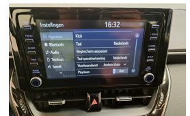
LAMAN AUTO'S WWW.LAMANAUTOS.NL