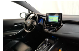
LAMAN AUTO'S WWW.LAMANAUTOS.NL