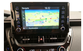
LAMAN AUTO'S WWW.LAMANAUTOS.NL