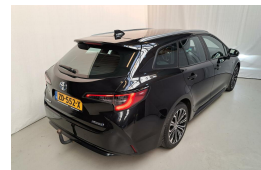
LAMAN AUTO'S WWW.LAMANAUTOS.NL