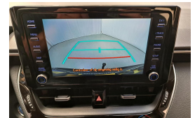
LAMAN AUTO'S WWW.LAMANAUTOS.NL