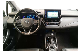
LAMAN AUTO'S WWW.LAMANAUTOS.NL